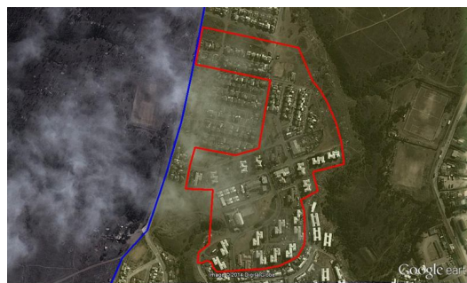
PLANICIES DE BELLAVISTA

El tercer barrió y para ejecución a partir del año 2016 es el de condominios sociales que se va instalar en las Planicies y a diferencia de los otros dos barrios el municipio en este barrio no hace aporte en los otros barrios si había un aporte y tiene un presupuesto cercano a los M$ 650.000 y reitero este con ejecución durante el año 2016