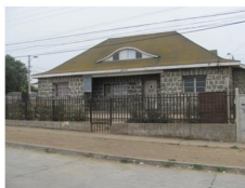
Possible obra de confianza

Que comprende la población Padre Hurtado, el sector 2 de Bellavista, Brasil y la población las Bodegas y Esmeralda, este sector tiene aproximadamente 500 viviendas y el 82% de los vecinos que se ubican en el sector están entre el 1 y 2 quintil por ficha protección social, este barrio va a tener un monto de ejecución cercano a los M$ 800.000 proyecto que como reitero inicia su ejecución durante el mes de julio de este año y hay una posible obra de confianza en ese sector con la cual se estuvo trabajando con los vecinos durante el principio de este año que es la intervención o mejoramiento de la casa de piedra